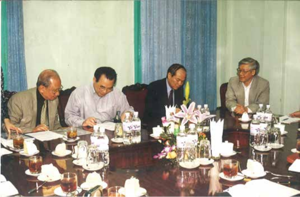
Các đồng chí Thường trực Hội đồng Lý luận Trung ương nhiệm kỳ 2001-2005 tại buổi tọa đàm “Tổng kết 20 năm đổi mới ở Việt Nam (1986-2006)”

cứu lý luận, Hội đồng đã có đóng góp quan trọng vào xây dựng nhiều nghị quyết của Ban Chấp hành Trung ương Đảng, vào xây dựng và bổ sung, phát triển Cương lĩnh của Đảng, vào xây dựng dự thảo nhiều văn kiện Đại hội Đảng. Thông qua các văn kiện quan trọng của Đảng, nhận thức lý luận về chủ nghĩa xã hội và con đường đi lên chủ nghĩa xã hội ở nước ta từng bước được hình thành, bổ sung, phát triển, ngày càng sáng tỏ hơn. Văn kiện Đại hội XIII nhận định: “Tư duy lý luận của Đảng có bước phát triển. Hệ thống lý luận về đường lối đổi mới, về chủ