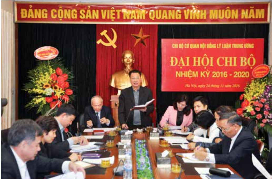
Đại hội Chi bộ cơ quan Hội đồng Lý luận Trung ương nhiệm kỳ 2016-2020