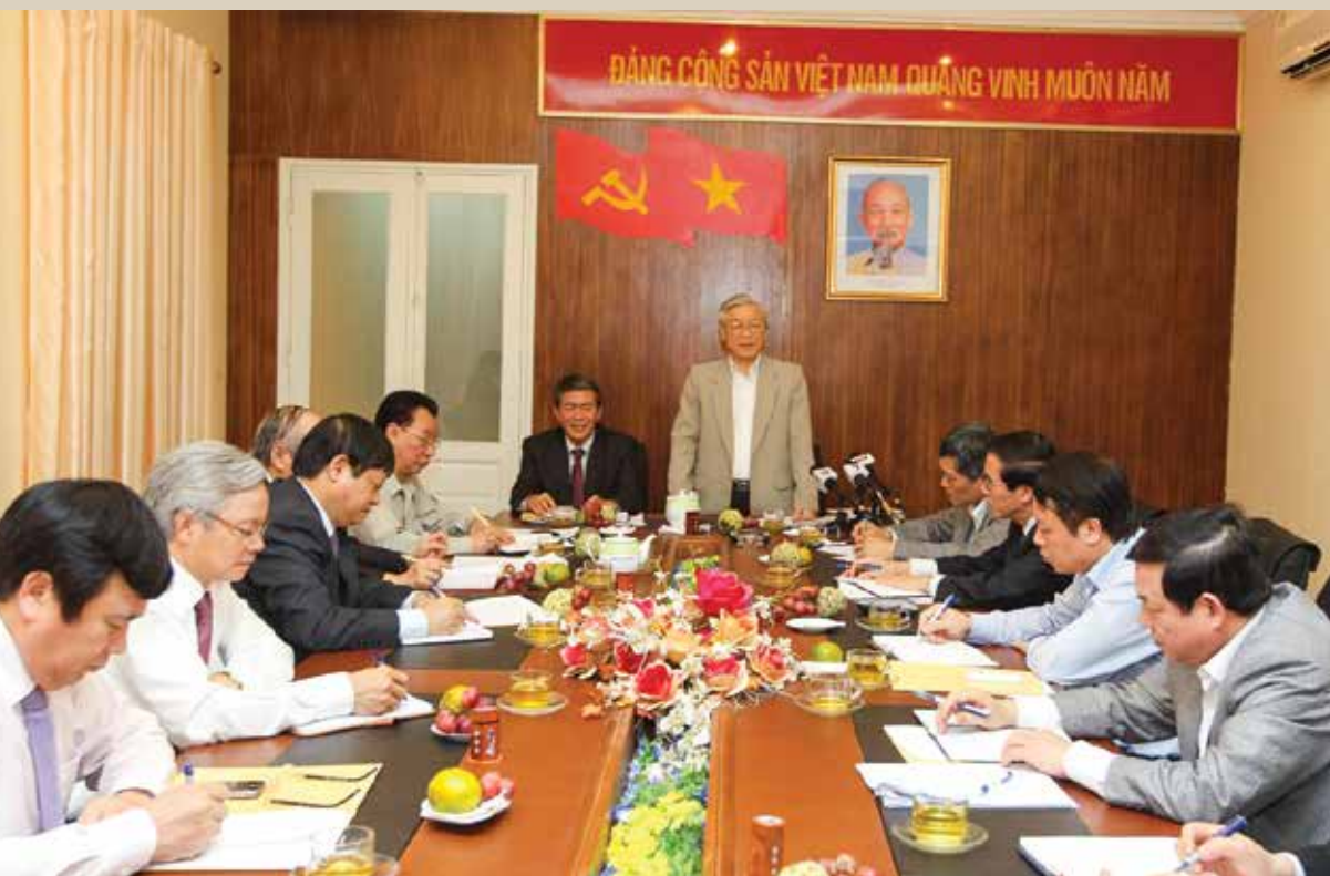
Tổng Bí thư Nguyễn Phú Trọng làm việc với Thường trực Hội đồng Lý luận Trung ương (tháng 3-2012)

gia trong và ngoài Hội đồng nhằm nâng cao chất lượng nghiên cứu lý luận và tổng kết thực tiễn, phục vụ trực tiếp cho việc cụ thể hóa Nghị quyết Đại hội XI, soạn thảo các văn kiện Đại hội XII của Đảng; trên cơ sở đó công bố một số ấn phẩm phục vụ công tác lãnh đạo, quản lý và nghiên cứu.