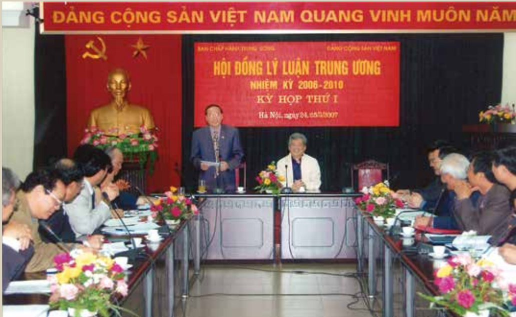
Đồng chí Tô Huy Rúa, Bí thư Trung ương Đảng, Trưởng ban Tư tưởng - Văn hóa Trung ương, Chủ tịch Hội đồng Lý luận Trung ương phát biểu khai mạc Kỳ họp thứ nhất Hội đồng Lý luận Trung ương nhiệm kỳ 2006-2010