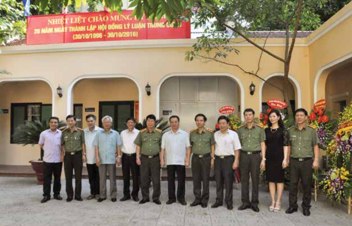
Đoàn Bộ Công an thăm và chúc mừng Hội đồng Lý luận Trung ương nhân dịp kỷ niệm 20 năm thành lập (30-10-1996 – 30-10-2016)

Bộ Công an tổ chức nghiên cứu thành công nhiều chuyên đề phục vụ tổng kết 30 năm thực hiện Cương lĩnh xây dựng đất nước trong thời kỳ quá độ lên chủ nghĩa xã hội; kết hợp tổ chức các cuộc hội thảo khoa học, gần đây nhất là Hội thảo khoa học cấp quốc gia “Bảo vệ nền tảng tư tưởng của Đảng, đấu tranh, phản bác các quan điểm sai trái, thù địch trong tình hình mới” được tổ chức trước thềm Đại hội XIII của Đảng, tạo được tiếng vang và ấn tượng tốt đẹp. Có được thành công này là do sự chỉ đạo chặt chẽ của Thường trực Hội đồng, sự nhiệt tình tham gia của các thành viên Hội đồng, Văn phòng