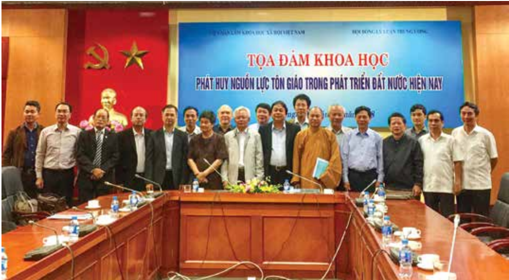
Các đại biểu dự tọa đàm khoa học “Phát huy nguồn lực tôn giáo trong phát triển đất nước hiện nay” do Hội đồng Lý luận Trung ương và Viện Hàn lâm Khoa học xã hội Việt Nam phối hợp tổ chức

kế thừa và phát triển trong điều kiện mới, đồng thời tiếp thu những tinh hoa của dân tộc và của thời đại, đặc biệt là vận dụng, phát triển sáng tạo vào thực tiễn Việt Nam. Đó là hệ thống lý luận về các vấn đề cơ bản của cách mạng Việt Nam từ khi Đảng ra đời, lãnh đạo cách mạng lập nên nhà nước dân chủ nhân dân đầu tiên ở Đông Nam châu Á cho đến khi xây dựng thành công chủ nghĩa xã hội ở Việt Nam. Rõ ràng rằng, đó chính là hệ thống lý luận cách mạng, khoa học và hoàn chỉnh về chủ nghĩa xã hội và con đường đi lên chủ nghĩa xã hội ở Việt Nam.