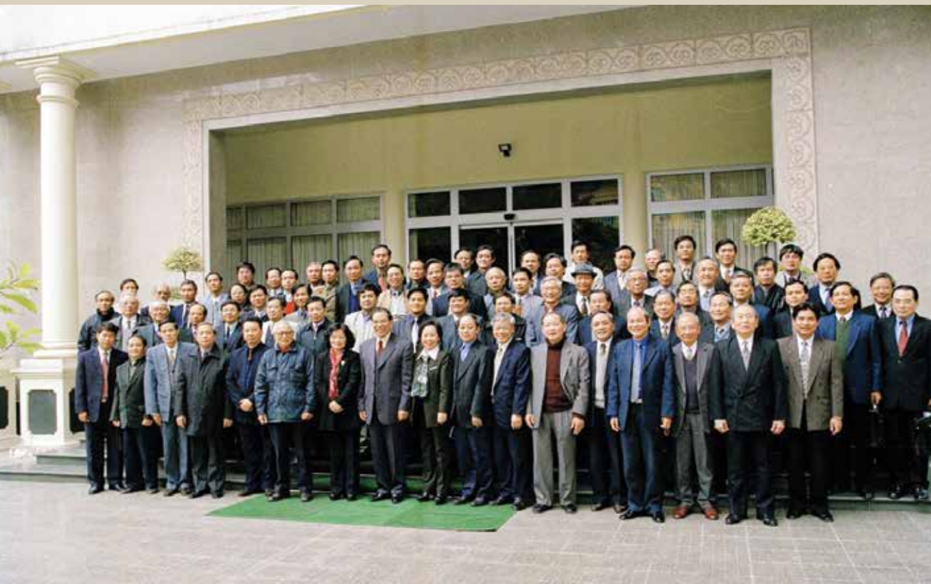
Tổng Bí thư Nông Đức Mạnh chụp ảnh với các đại biểu và thành viên Hội đồng Lý luận Trung ương nhiệm kỳ 1996-2000 và nhiệm kỳ 2001-2005 (ngày 29-01-2002)

Bộ Chính trị. Ban Tài chính - Quản trị Trung ương bảo đảm về tài chính cho hoạt động của Hội đồng.