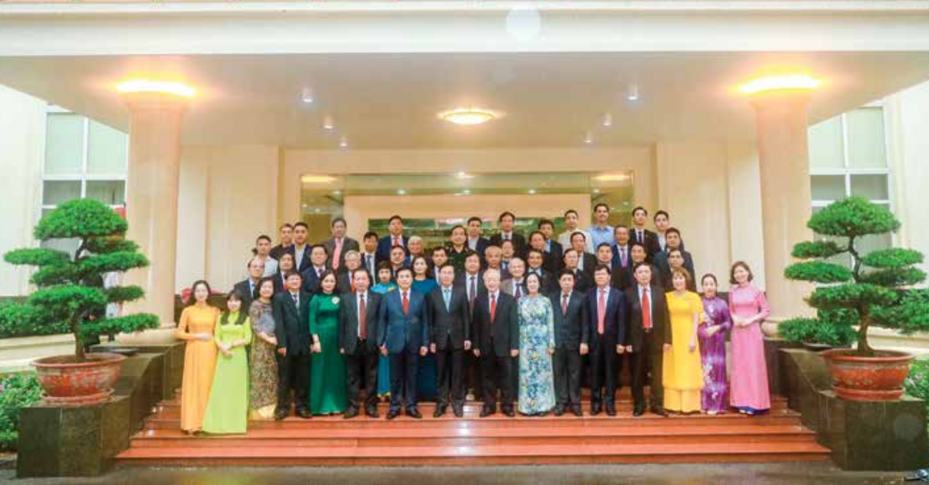
Tổng Bí thư Nguyễn Phú Trọng chụp ảnh kỷ niệm với cán bộ, công nhân viên cơ quan Hội đồng Lý luận Trung ương

NHIỆT LIỆT CHÀO MỪNG CÁC ĐẠI BIỂU VỀ DỰ HỘI NGHỊ TỔNG KẾT HỘI ĐỒNG LÝ LUẬN TRUNG ƯƠNG NHIỆM KỲ 2016 - 2021