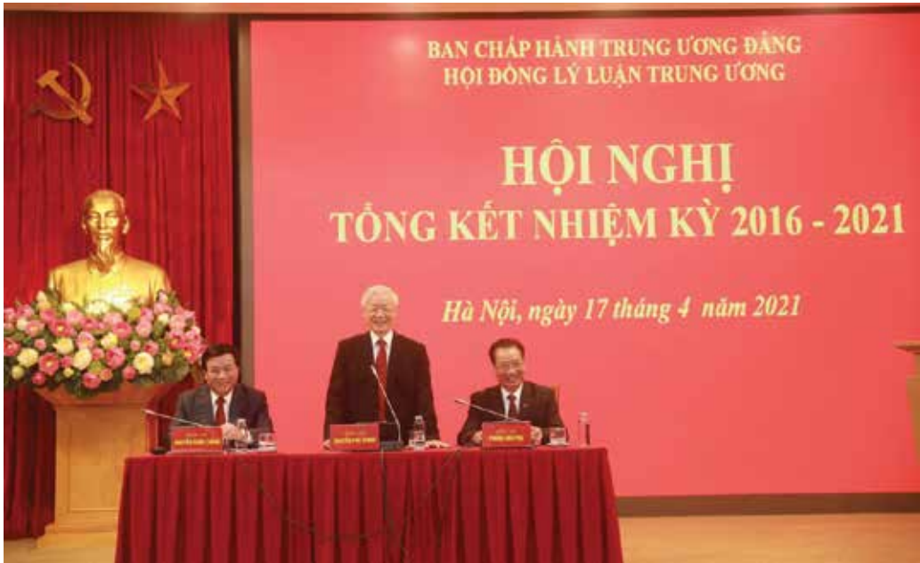
Tổng Bí thư Nguyễn Phú Trọng dự Hội nghị tổng kết nhiệm kỳ 2016-2021 của Hội đồng Lý luận Trung ương

Ban Chấp hành Trung ương, Bộ Chính trị, Ban Bí thư sớm kết luận những vấn đề thực tiễn đã chín, đã rõ; xây dựng các chuyên đề lý luận có chất lượng để phục vụ chương trình nghiên cứu của Bộ Chính trị, Ban Bí thư; triển khai có hiệu quả Chương trình nghiên cứu lý luận chính trị giai đoạn 2021-2025; phục vụ Ban Chấp hành Trung ương, Bộ Chính trị, Ban Bí thư ban hành các nghị quyết, kết luận; góp phần đưa Nghị quyết Đại hội XIII vào cuộc sống.