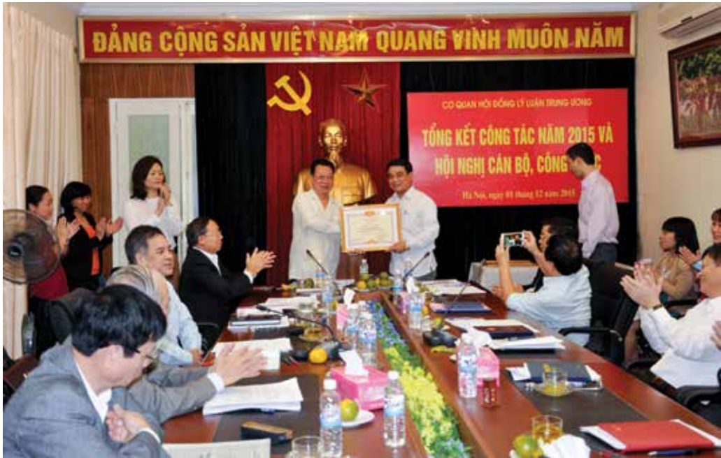
Hội nghị tổng kết công tác năm 2015 và Hội nghị cán bộ, công chức cơ quan Hội đồng Lý luận Trung ương