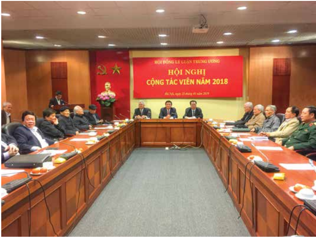
Hội nghị cộng tác viên Hội đồng Lý luận Trung ương năm 2018

ngày nay có nhiều trào lưu, học thuyết, mô hình chế độ xã hội khác nhau, kể cả những vấn đề liên quan đến “chủ nghĩa xã hội”. Tuy nhiên, chỉ có lý luận nào kế thừa, tiếp thu được tinh hoa của nhân loại, được chính đảng tiên phong đại diện cho lợi ích giai cấp công nhân, nhân dân, cả dân tộc vận dụng thành công, sáng tạo vào thực tiễn đất nước thì lý luận đó, nói như Chủ tịch Hồ Chí Minh, là chân chính nhất, cách mạng nhất.