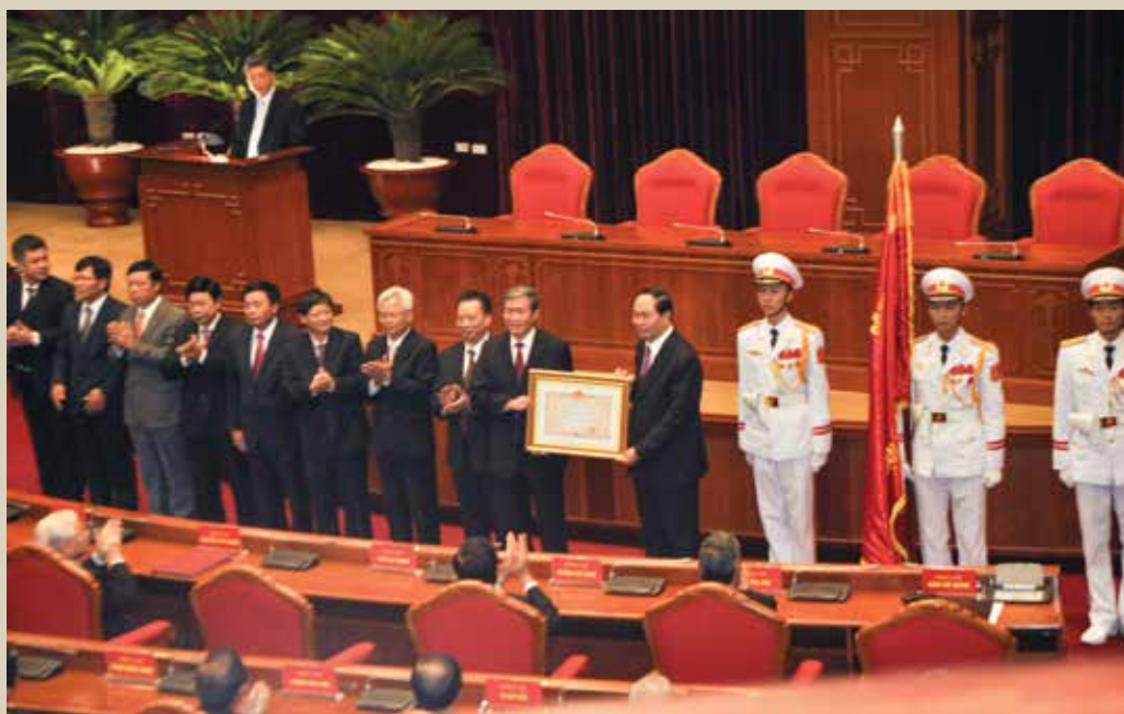
Chủ tịch nước Trần Đại Quang trao Huân chương Độc lập hạng Nhất cho Hội đồng Lý luận Trung ương nhân dịp kỷ niệm 20 năm Ngày thành lập (1996-2016)

Tổng Bí thư Nguyễn Phú Trọng tại Hội nghị tổng kết công tác của Hội đồng Lý luận Trung ương nhiệm kỳ 2016-2021 đã đánh giá: "Hội đồng đã luôn bám sát đường lối, chủ trương của Đảng, chương trình làm việc của Ban Chấp hành Trung ương, Bộ Chính trị, Ban Bí thư; tranh thủ sự ủng hộ, giúp đỡ, phát huy các mặt thuận lợi, kinh nghiệm hoạt động và thế mạnh của Hội đồng, khắc phục các khó khăn, thách thức, triển khai một khối lượng lớn công việc, có bước tiến mới, hoàn thành tốt chức năng, nhiệm vụ được giao, đặc biệt là đã thực hiện tốt nhiệm vụ nghiên cứu, tư vấn; Xây dựng một số báo cáo tư vấn có chất lượng, góp phần giúp Ban Chấp hành Trung ương, Bộ Chính trị ban hành các nghị quyết, kết luận quan trọng về các vấn đề như: Xây dựng, hoàn thiện đồng bộ thể chế phát triển; thể chế kinh tế thị trường định hướng xã hội chủ nghĩa; mối quan hệ giữa Nhà nước, thị trường và xã hội; định hướng phát triển kinh tế tư nhân trở thành một động lực quan trọng của nền kinh tế; xây dựng và hoàn thiện tổ chức bộ máy của