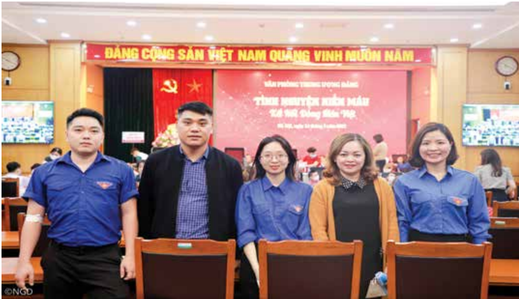
Đoàn viên Chi đoàn cơ quan Hội đồng Lý luận Trung ương tham gia phong trào tình nguyện hiến máu