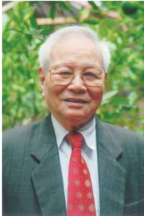
GS. Nguyễn Đức Bình

Để luận chứng cho sự lựa chọn xã hội chủ nghĩa là sự lựa chọn duy nhất đúng đối với con đường phát triển đất nước ta, không thể không tiến hành một cuộc tổng kết sâu sắc, quy mô về lịch sử. Để có cơ sở vững chắc, không gì lay chuyển nổi cho niềm tin của nhân dân và ngay cả cho chính chúng ta, vào con đường xã hội chủ nghĩa; để có cơ sở bác bỏ tận gốc những luận điệu đối trá, xuyên tạc, những sự phê phán vô căn cứ, những cái gọi là “học thuyết mới”, “cách tiếp cận mới” nhưng thực chất vẫn là thiên kiến tư sản về con đường đi của nhân loại thời nay, tôi nghĩ đã đến lúc phải đặt lên bàn một loạt câu