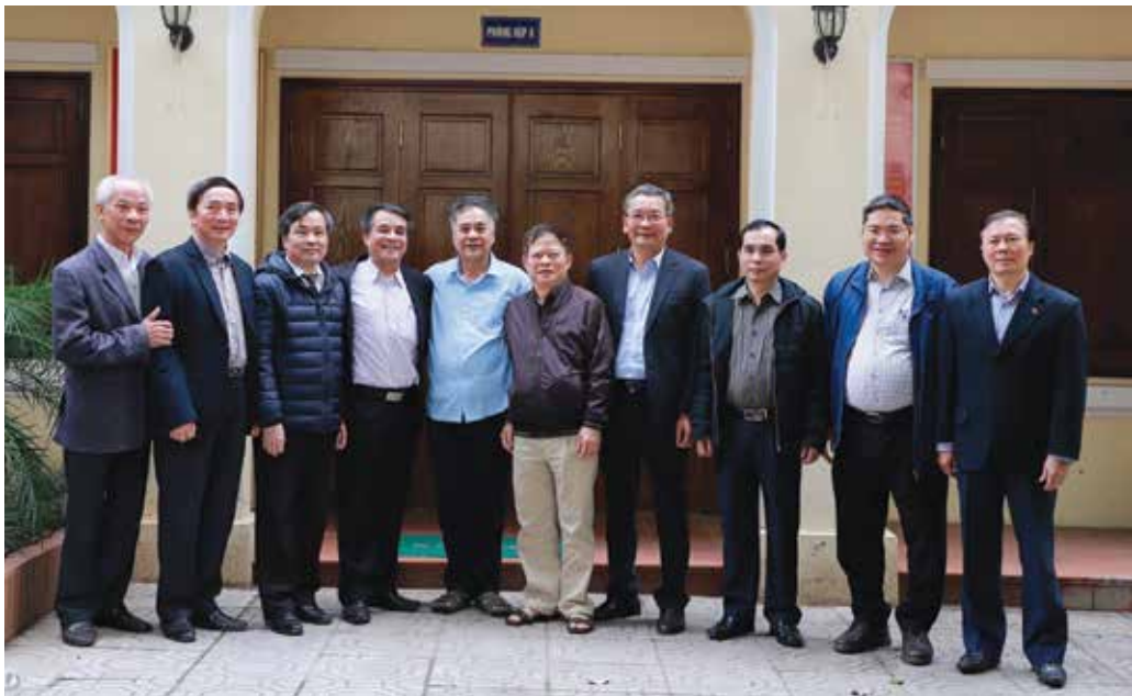
Ban Thư ký Hội đồng Lý luận Trung ương (tháng 3-2021)