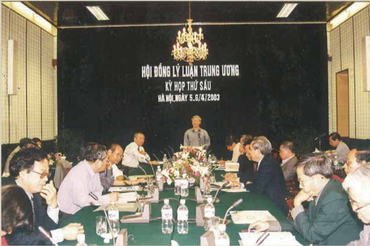
Đồng chí Nguyễn Phú Trọng, Ủy viên Bộ Chính trị, Bí thư Thành ủy Hà Nội, Chủ tịch Hội đồng Lý luận Trung ương phát biểu chỉ đạo tại Kỳ họp thứ sáu Hội đồng Lý luận Trung ương nhiệm kỳ 2001-2005