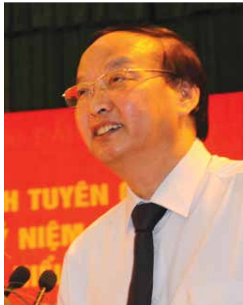
PGS.TS. Tô Huy Rúa

Đại hội X của Đảng đã khẳng định: Hai mươi năm qua, với sự nỗ lực phấn đấu của toàn Đảng, toàn dân, toàn quân, công cuộc đổi mới ở nước ta đã đạt được những thành tựu to lớn và có ý nghĩa lịch sử... Những thành tựu đó chứng tỏ đường lối đổi mới của Đảng ta là đúng đắn, sáng tạo, phù hợp với thực tiễn Việt Nam. Nhận thức về chủ nghĩa xã hội và con đường đi lên chủ nghĩa xã hội ngày càng sáng tỏ hơn; hệ thống quan điểm lý luận về công cuộc đổi mới, về xã hội xã hội chủ nghĩa và con đường đi lên chủ nghĩa xã hội ở