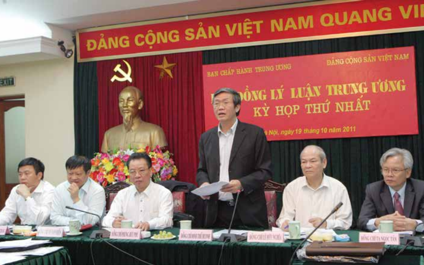
Đồng chí Đinh Thế Huỳnh, Ủy viên Bộ Chính trị, Bí thư Trung ương Đảng, Trưởng ban Tuyên giáo Trung ương, Chủ tịch Hội đồng Lý luận Trung ương phát biểu khai mạc Kỳ họp thứ nhất Hội đồng Lý luận Trung ương nhiệm kỳ 2011-2015

trình đổi mới; không ngừng phát triển lý luận, đề ra đường lối và chủ trương đáp ứng yêu cầu phát triển đất nước; khắc phục một số mặt lạc hậu, yếu kém của công tác nghiên cứu lý luận. Nâng cao chất lượng hoạt động của các cơ quan nghiên cứu lý luận, cải tiến tổ chức nghiên cứu lý luận phù hợp hơn với nhu cầu thực tiễn. Tổng kết 30 năm đổi mới đất nước.