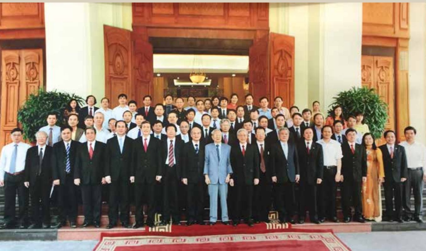
Tổng Bí thư Nguyễn Phú Trọng chụp ảnh cùng các đại biểu và thành viên Hội đồng Lý luận Trung ương nhiệm kỳ 2011-2015

tư vấn, nghiên cứu, đào tạo trong cả nước. Như vậy, nhiệm kỳ này các thành viên Hội đồng được kiện toàn tăng thêm cả về số lượng (từ 33 lên 42 đồng chí) và chất lượng.