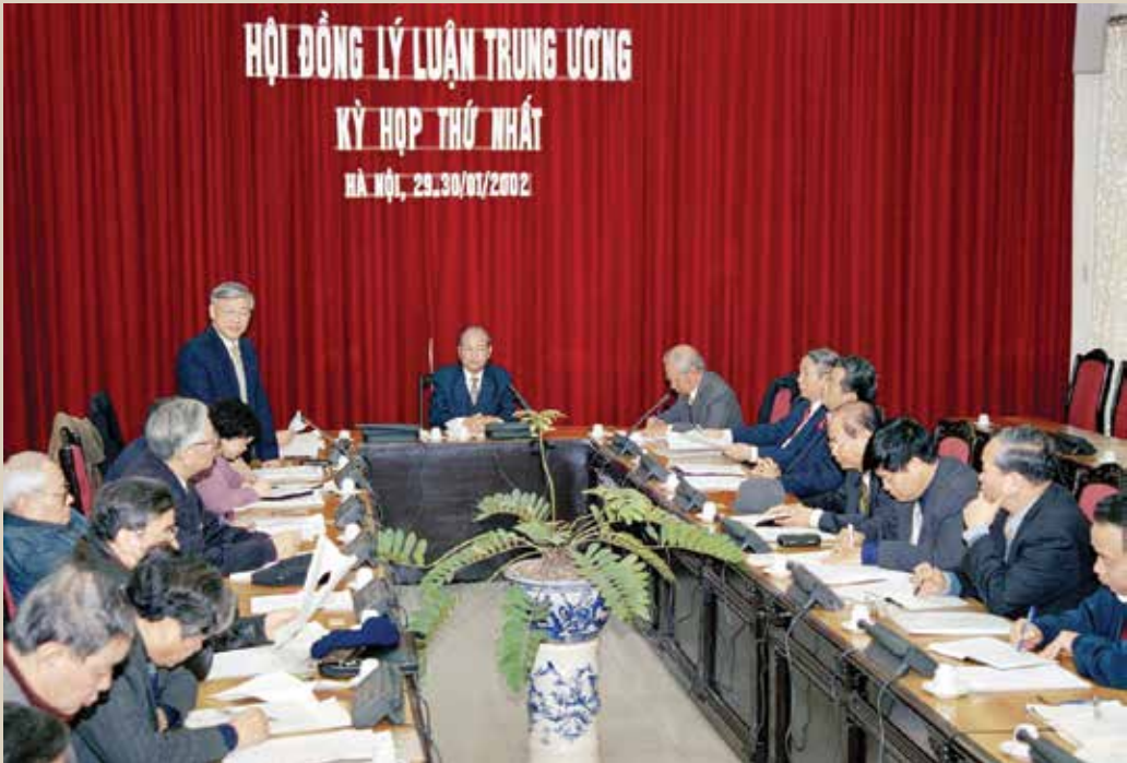
Đồng chí Nguyễn Phú Trọng, Ủy viên Bộ Chính trị, Bí thư Thành ủy Hà Nội, Chủ tịch Hội đồng Lý luận Trung ương phát biểu chỉ đạo tại Kỳ họp thứ nhất Hội đồng Lý luận Trung ương nhiệm kỳ 2001-2005