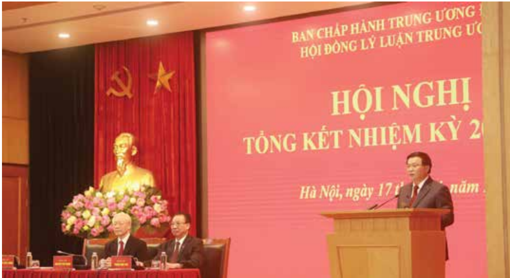
GS.TS. Nguyễn Xuân Thắng, Ủy viên Bộ Chính trị, Chủ tịch Hội đồng Lý luận Trung ương, Giám đốc Học viện Chính trị quốc gia Hồ Chí Minh phát biểu khai mạc Hội nghị tổng kết Hội đồng Lý luận Trung ương nhiệm kỳ 2016-2021