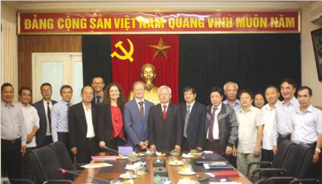
Chụp ảnh kỷ niệm với đoàn Đại học Phần Lan sang thăm và trao đổi kinh nghiệm về phát triển giáo dục với Hội đồng Lý luận Trung ương (tháng 12-2018)

Đảng Cộng sản Nhật Bản; 1 cuộc hội thảo lý luận với Đảng Cộng sản Pháp; 2 cuộc đối thoại lý luận với Đảng Dân chủ Xã hội Đức.