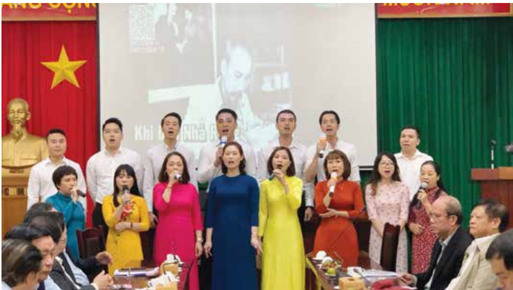
Một tiết mục văn nghệ của Chi đoàn thanh niên nhân dịp kỷ niệm 24 năm thành lập Hội đồng