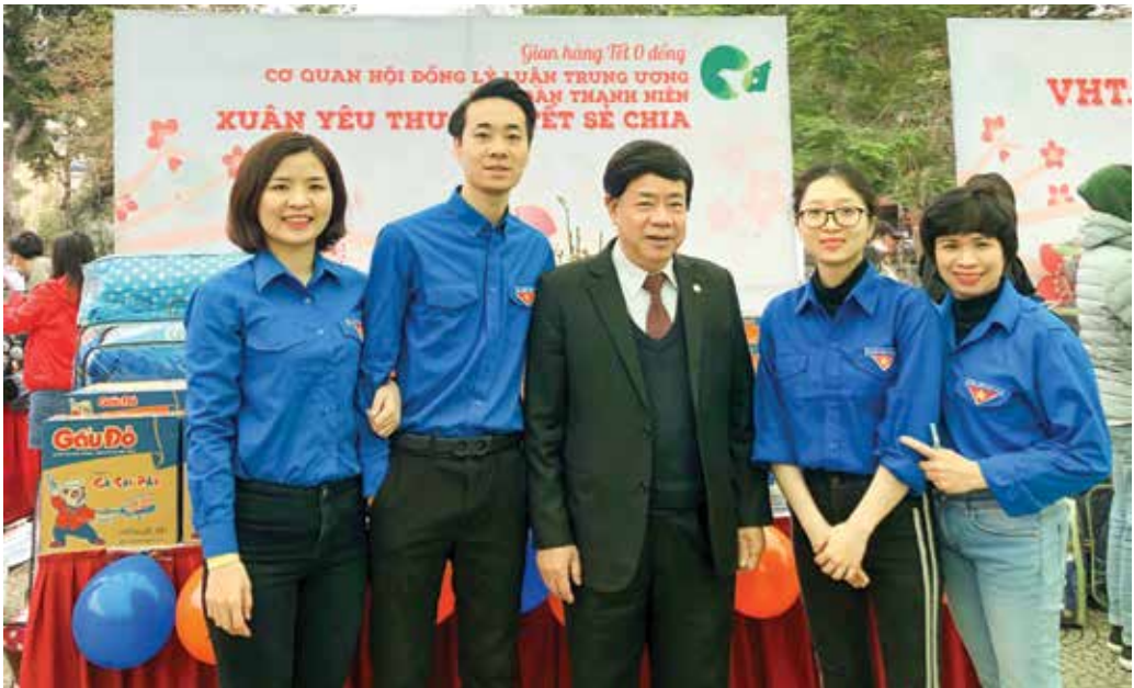
Đoàn viên Chi đoàn cơ quan Hội đồng Lý luận Trung ương tham gia "Phiên chợ 0 đồng" ủng hộ những người bệnh có hoàn cảnh khó khăn