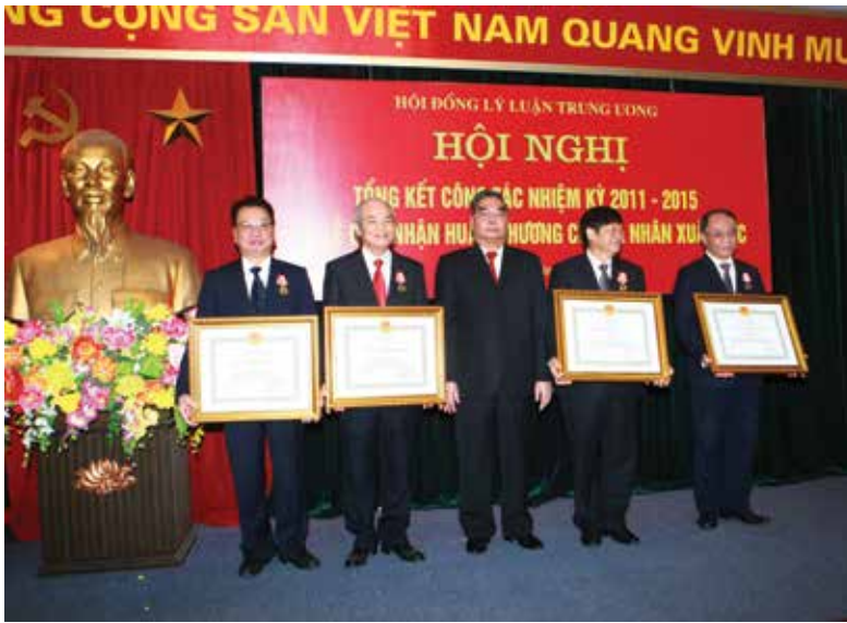
Đồng chí Lê Hồng Anh, Ủy viên Bộ Chính trị, Thường trực Ban Bí thư trao Huân chương Độc lập cho các cá nhân xuất sắc của Hội đồng Lý luận Trung ương