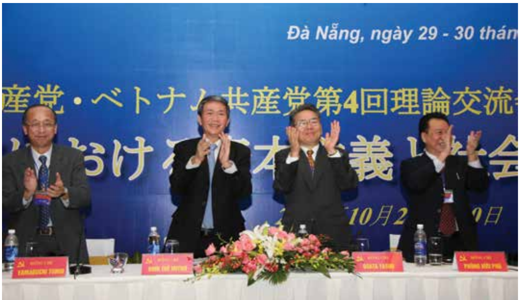
Cuộc trao đổi lý luận lần thứ tư giữa Đảng Cộng sản Việt Nam và Đảng Cộng sản Nhật Bản tổ chức tại Đà Nẵng (năm 2011)