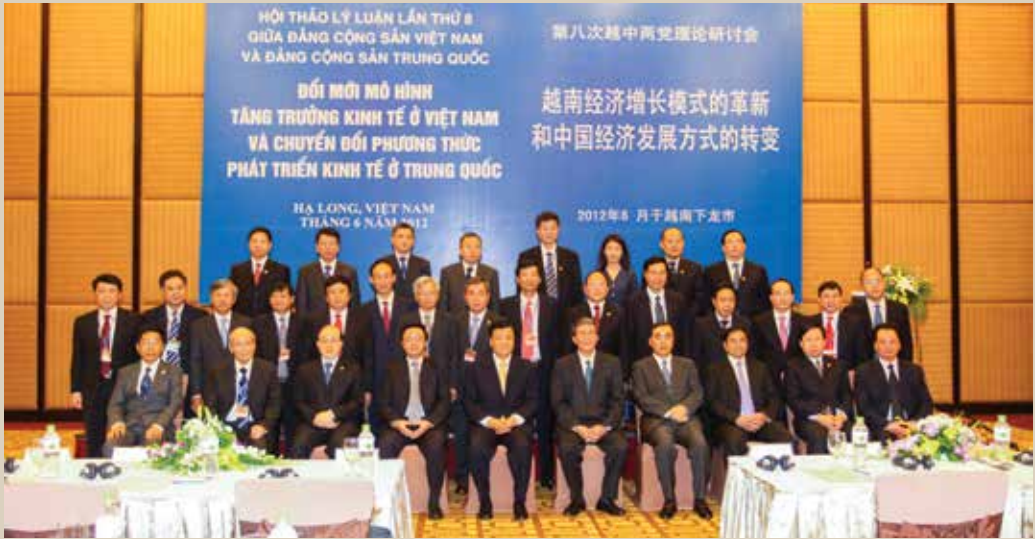
Hội thảo lý luận lần thứ tám giữa Đảng Cộng sản Việt Nam và Đảng Cộng sản Trung Quốc tổ chức tại Quảng Ninh (năm 2012)