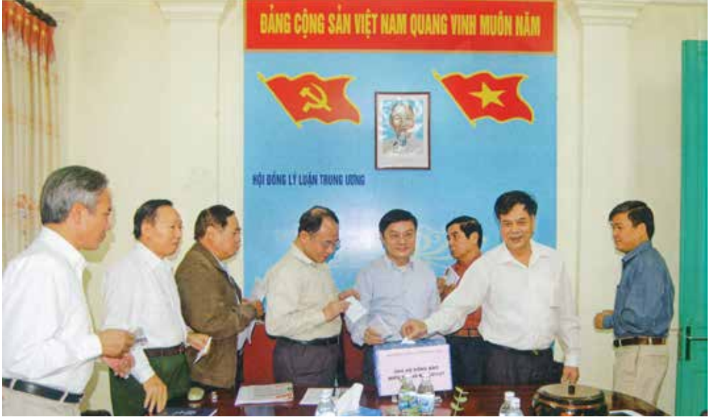
Công đoàn cơ quan Hội đồng Lý luận Trung ương tổ chức quyên góp ủng hộ đồng bào miền Trung bị lũ lụt