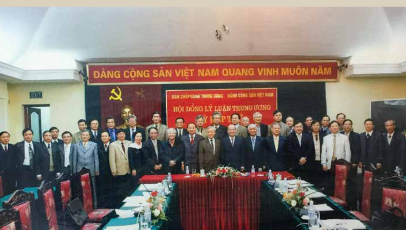
Đồng chí Nguyễn Phú Trọng, Ủy viên Bộ Chính trị, Chủ tịch Quốc hội và các đại biểu tham dự Kỳ họp thứ tư Hội đồng Lý luận Trung ương nhiệm kỳ 2006-2010

33 thành viên Hội đồng. Trong nhiệm kỳ, Thường trực Hội đồng đã đề nghị Ban Bí thư thay 3 thành viên Hội đồng chuyển sang làm nhiệm vụ khác và bổ sung thêm 2 thành viên mới, đưa tổng số thành viên Hội đồng lên 35 đồng chí, trong đó, có 01 đồng chí là Ủy viên Bộ Chính trị, 8 đồng chí là Ủy viên Trung ương Đảng, 6 đồng chí là cấp thứ trưởng, các thành viên còn lại là cán bộ lãnh đạo cấp cục, vụ, viện của các cơ quan quản lý, tham mưu, tư vấn, nghiên cứu, đào tạo trong cả nước. Trong nhiệm kỳ có sự thay đổi: đồng chí Phó Chủ tịch Thường trực chuyên trách nghỉ hưu từ ngày 01-01-2008, nên Bộ Chính trị đã cử đồng chí Ủy viên Trung ương Đảng, Phó Trưởng ban Thường trực Ban Tuyên giáo Trung ương kiêm Phó Chủ tịch Thường trực Hội đồng Lý luận Trung ương.