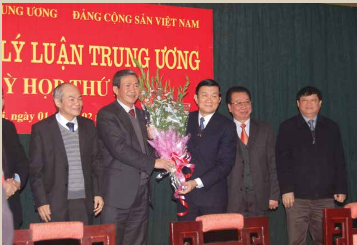
Chủ tịch nước Trương Tấn Sang và các đồng chí lãnh đạo Hội đồng Lý luận Trung ương tại Kỳ họp thứ hai của Hội đồng (tháng 2-2012)