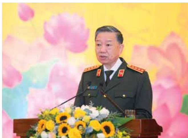
Đại tướng, GS.TS. Tô Lâm

T hay mặt Đảng ủy Công an Trung ương, Bộ Công an, đội ngũ các nhà khoa học, nhà nghiên cứu lý luận trong Công an và toàn lực lượng Công an nhân dân, tôi xin gửi lời chúc mừng tốt đẹp nhất tới Hội đồng Lý luận Trung ương, các đồng chí trong Ban Nghiên cứu lý luận - Hội đồng Lý luận Trung ương nhân dịp kỷ niệm 25 năm Ngày thành lập (30-10-1996 - 30-10-2021). Trân trọng cảm ơn Hội đồng Lý luận Trung ương trong suốt chặng đường xây dựng, trưởng thành đã dành sự quan tâm, tạo điều kiện, phối hợp chặt chẽ với Bộ Công an trong các lĩnh vực công tác, đặc biệt là công tác lý luận, góp phần thực hiện thắng lợi nhiệm vụ bảo đảm an ninh, trật tự, xây dựng Công an nhân dân trong sạch, vững mạnh, xứng đáng là lực lượng vũ trang trọng yếu, tin cậy của Đảng, Nhà nước và Nhân dân.