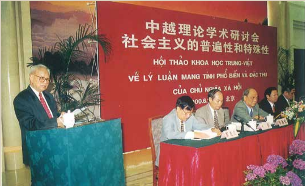
Đổng chí Nguyễn Đức Bình, Ủy viên Bộ Chính trị, Chủ tịch Hội đồng Lý luận Trung ương nhiệm kỳ 1996-2000 đọc báo cáo tại Hội thảo khoa học Trung - Việt về lý luận mang tính phổ biến và đặc thù của chủ nghĩa xã hội

sản xuất theo định hướng xã hội chủ nghĩa và thực hiện tiến bộ, công bằng xã hội”. Chương trình KHXH.04 (6 đề tài) tập trung nghiên cứu những vấn đề về “phát triển văn hóa, xây dựng con người trong thời kỳ công nghiệp hóa, hiện đại hóa đất nước”. Chương trình KHXH.05 (7 đề tài) tập trung nghiên cứu những nội dung liên quan đến yêu cầu “Tăng cường vai trò lãnh đạo và sức chiến đấu của Đảng trong điều kiện nền kinh tế nhiều thành phần và cơ chế thị trường theo định hướng xã hội chủ nghĩa”. Chương trình KHXH.06 (7 đề tài) tập trung nghiên cứu “Những vấn đề chiến lược chủ yếu của công cuộc bảo vệ Tổ quốc Việt Nam xã hội chủ nghĩa trong thời kỳ đẩy mạnh công nghiệp hóa, hiện đại hóa ở nước ta”...