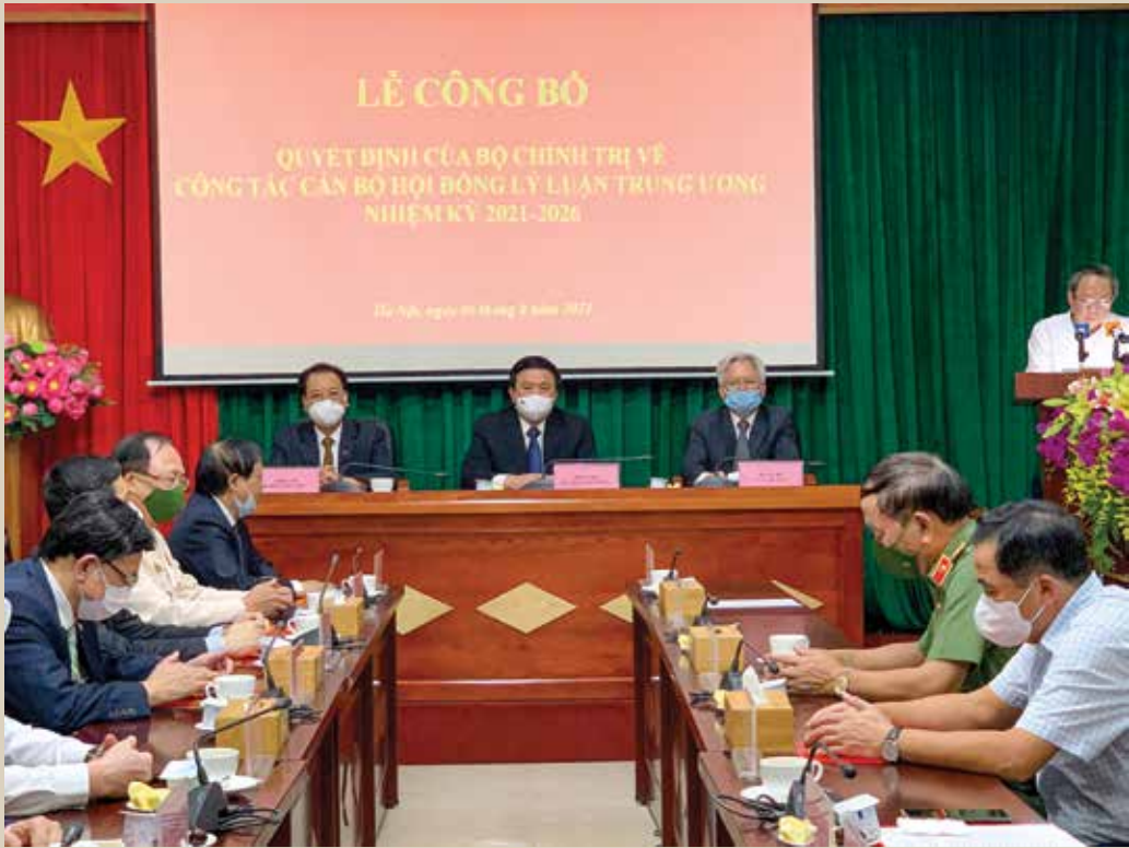
Lễ công bố quyết định của Bộ Chính trị về công tác cán bộ Hội đồng Lý luận Trung ương nhiệm kỳ 2021-2026, ngày 06-8-2021