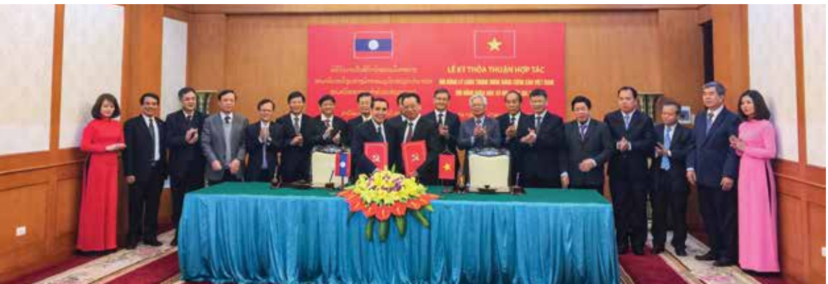
Lễ ký thỏa thuận hợp tác giữa Hội đồng Lý luận Trung ương Đảng Cộng sản Việt Nam với Hội đồng Khoa học Quốc gia Lào

Tham quan cánh đồng lúa cao sản xã Đông Phương, huyện Đông Hưng trong đợt nghiên cứu "Tổng kết một số vấn đề lý luận, thực tiễn qua 30 năm thực hiện Cương lĩnh xây dựng đất nước trong thời kỳ quá độ lên chủ nghĩa xã hội, trọng tâm là 10 năm thực hiện Cương lĩnh 2011" tại Thái Bình