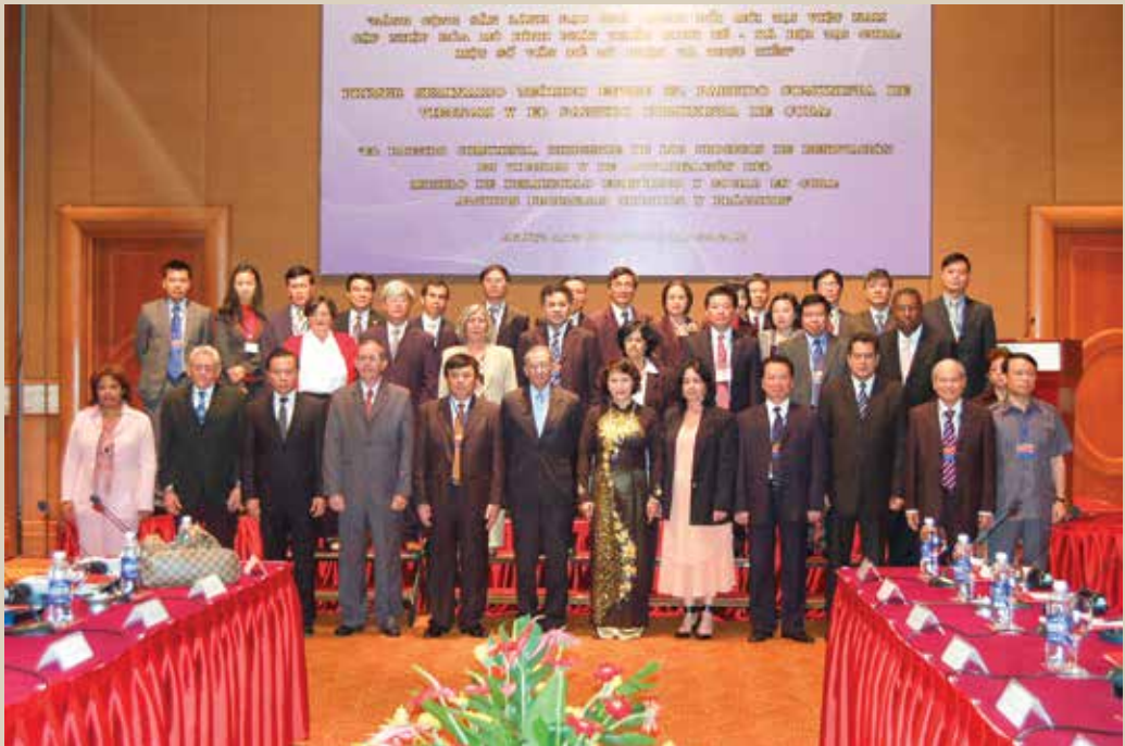
Hội thảo lý luận lần thứ nhất giữa Đảng Cộng sản Việt Nam và Đảng Cộng sản Cuba tổ chức tại Hà Nội (năm 2012)