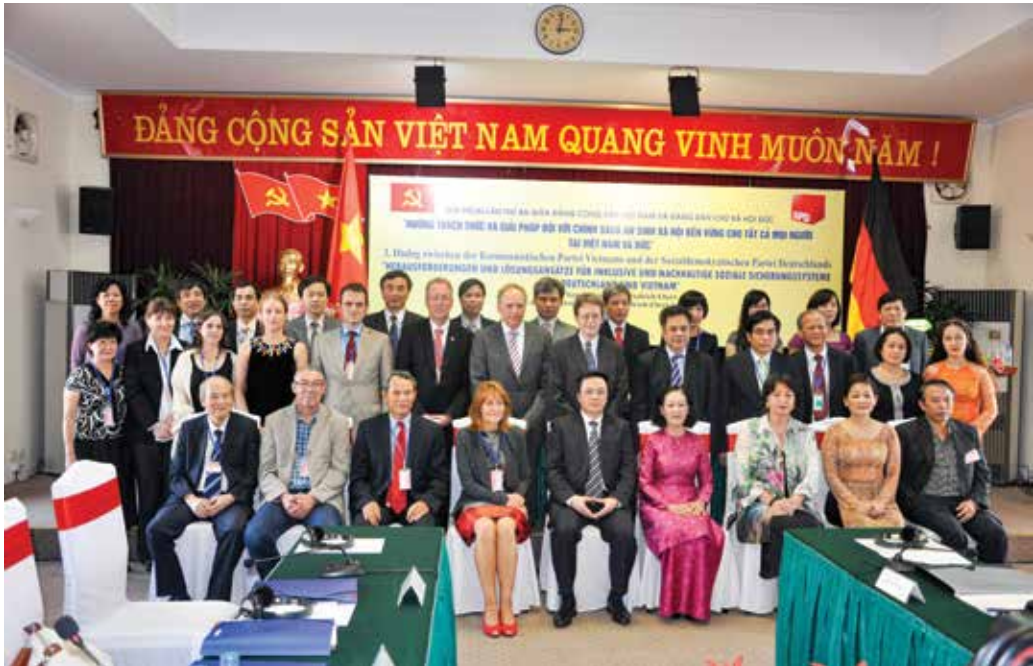
Đối thoại lý luận lần thứ ba giữa Đảng Cộng sản Việt Nam và Đảng Dân chủ Xã hội Đức tổ chức tại Hà Nội (năm 2013)