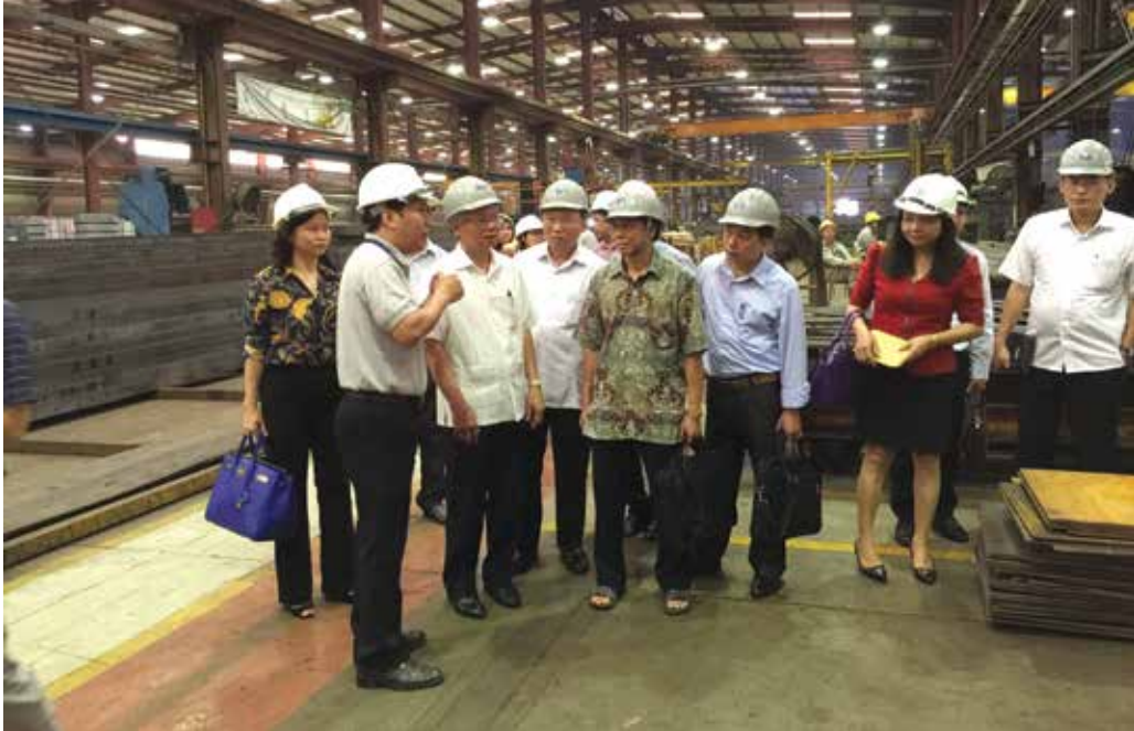
Khảo sát về công nhân, công đoàn tại Khu công nghiệp Thăng Long (Đông Anh - Hà Nội)

triển đất nước đang đặt ra, xây dựng cơ sở khoa học và thực tế phục vụ tốt cho việc hoạch định đường lối, chính sách của Đảng, Nhà nước.