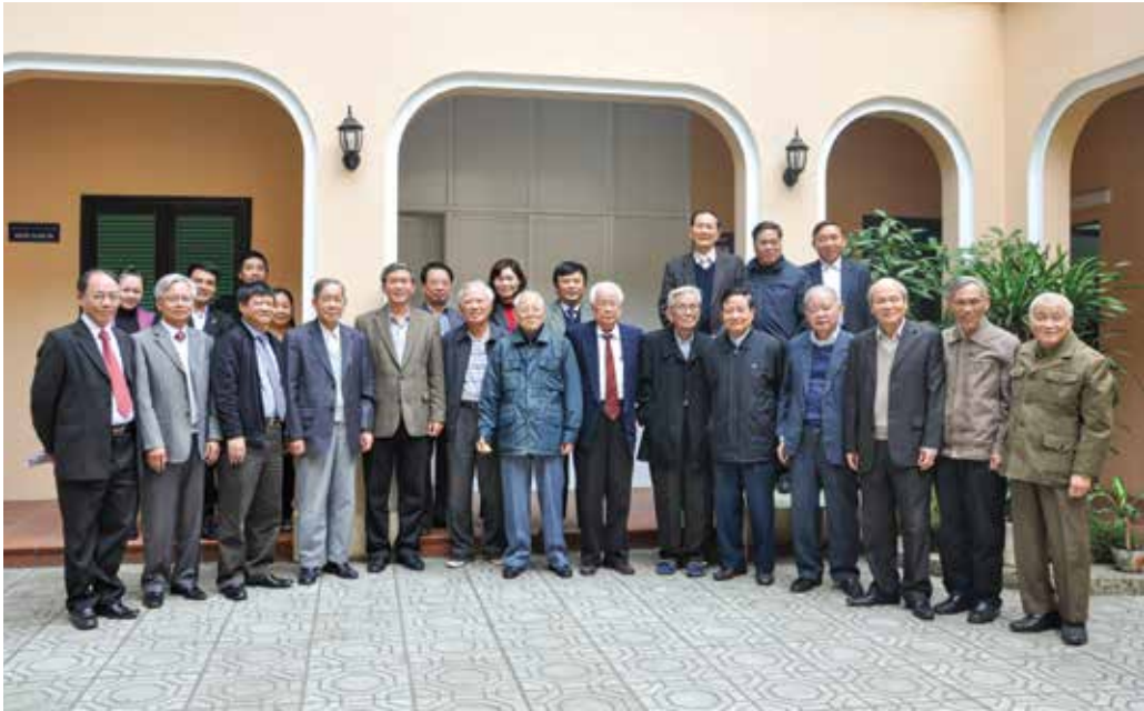
Các đại biểu dự hội nghị cộng tác viên của Hội đồng năm 2012