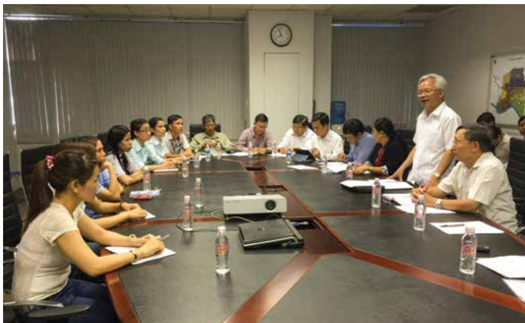
Khảo sát về công nhân và công đoàn tại Khu công nghiệp Bình Dương

Việc xây dựng, sử dụng đội ngũ cán bộ, chuyên gia lý luận – từ công tác đào tạo ban đầu, đào tạo, bồi dưỡng chuyên gia đến chế độ sử dụng, đãi ngộ với cán bộ nghiên cứu lý luận, nhất là cán bộ khoa học đầu ngành, cần được đổi mới đồng bộ. Cần có chính sách thu hút nhân tài vào các ngành – đào tạo, nghiên cứu lý luận chính trị thông qua chính sách đãi ngộ thích đáng và nhiều biện pháp ưu đãi khác. Đối