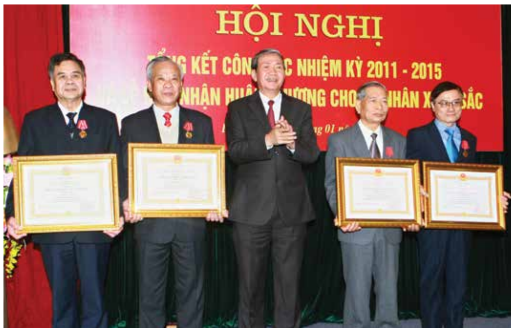
Đồng chí Đinh Thế Huynh trao tặng Huân chương Lao động cho các cá nhân có thành tích xuất sắc