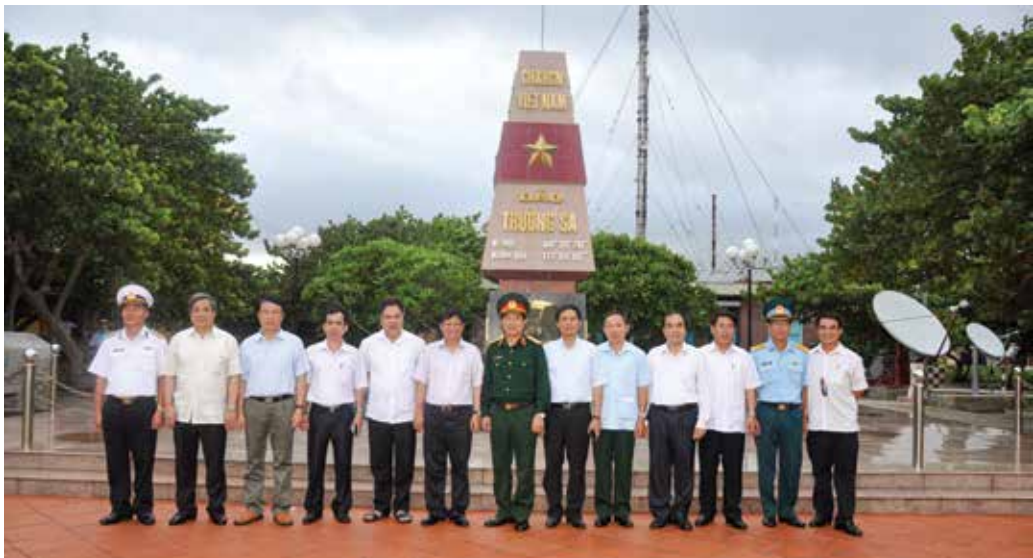
Đoàn đại biểu Hội đồng Lý luận Trung ương thăm và làm việc tại quần đảo Trường Sa