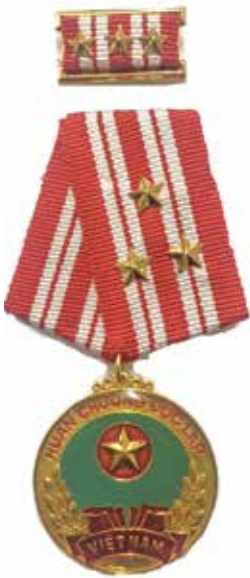
Huân chương Độc lập hạng Nhất

“ Thành lập Hội đồng Lý luận Trung ương để tư vấn cho Bộ Chính trị về công tác lý luận; giúp Thường vụ Bộ Chính trị chỉ đạo phương hướng, nội dung các chương trình nghiên cứu khoa học xã hội thời kỳ 1996-2000 nhằm xây dựng lý luận về chủ nghĩa xã hội và con đường đi lên chủ nghĩa xã hội của Việt Nam”.