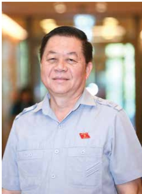
Thượng tướng Nguyễn Trọng Nghĩa

Là một cơ quan tư vấn cho Ban Chấp hành Trung ương Đảng, Bộ Chính trị, Ban Bí thư về các vấn đề lý luận chính trị, Hội đồng Lý luận Trung ương những năm qua đã có những đóng góp rất to lớn, quan trọng vào công tác bảo vệ nền tảng tư tưởng của Đảng, đấu tranh phản bác các quan điểm sai trái, thù địch, nhất là trong xây dựng các luận cứ lý luận, khoa học cũng như trực tiếp đấu tranh với các quan điểm sai trái, thù địch... Để tiếp tục phát huy thế mạnh của Hội đồng và đáp ứng yêu cầu đặt ra trong tình hình mới, theo tôi Hội đồng Lý luận Trung ương cần và có thể đẩy mạnh nghiên cứu, đổi mới, sáng tạo, giúp giải quyết các nhiệm vụ với các giải pháp sau: