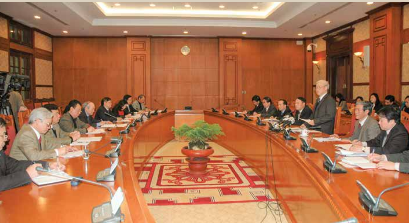
Tổng Bí thư Nguyễn Phú Trọng làm việc với Hội đồng Lý luận Trung ương nhiệm kỳ 2011-2015 (tháng 12-2013)